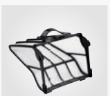
Filterkorb grob (200µ)