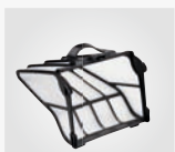
Filterkorb grob (200µ)