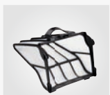
Filterkorb sehr fein (60µ)