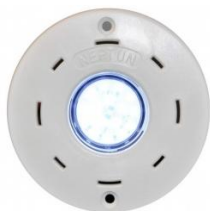
Unterwasserscheinwerfer LED Neptun mini Spezial