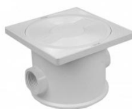
Kabelanschlussdose für Unterwasserscheinwerfer

(inkl. 19% MwSt., inkl. Versandkosten für Deutschland)